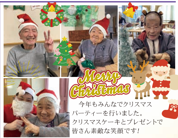
Merry Christmas 今年もみんなでクリスマスパーティーを行いました。クリスマスケーキとプレゼントで皆さん素敵な笑顔です!