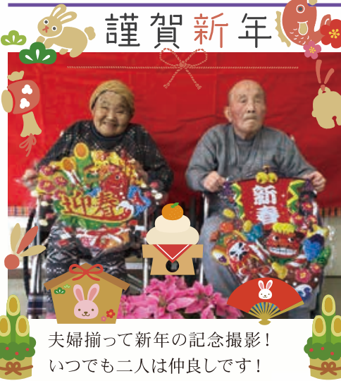
夫婦揃って新年の記念撮影! いつでも二人は仲良しです!