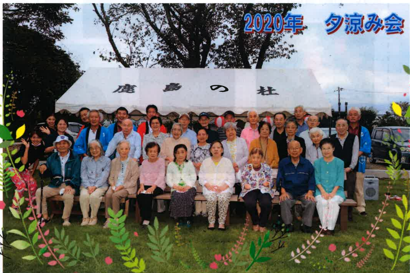
夕涼み会でグランドゴルフホールインワン大会・射的・盆踊りをしました(^▽^)/

令和2年度秋冬号 2021年3月1日発行 茨城県鹿嶋市須賀1346-5 TEL 0299-84-7611 FAX 0299-84-7613